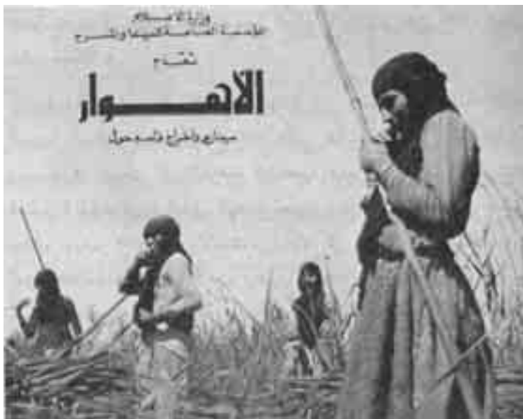
مشهد من فيلم «الأهوار» - العراق

عام 1979 فيلمه الروائي الاول (تحت سماء واحدة). والتلفزيون العراقي بدأ خطوة الانتاج السينمائي بعدد من المشاريع، بينها مسلسل (التمردون) وافلام روائية قصيرة عن السينما الفلسطينية ابرزها فيلم (انتفاضة)، ويمكن أن نقول بعد هذا العرض الشامل لمسيرة السينما في العراق إن الانتاج السينمائي فيها بدأ متأخرا، من حيث التاريخ الزمني، عشرين عاما عن بداياته في كل من مصر (1927) وسورية (1928) ولبنان (1929) اذا اعتبرنا فيلم (عليا وعصام) الذي انتج عام 1948 هو البداية، كما يمكن ان نعتبر عام 1953 بداية الانتاج المحلي المحض، إذ أن مبادرة انتاج فيلم (فتنة وحسن) شجعت عددا من السينمائيين الشبان على خوض هذه التجربة، فكانت أفلام مثل: ندم -وردة- تسواهن -عروس الفرات -من المسؤول -ارحموني-الدكتور حسن -سعيد أفندي، وغيرها، ويمكن أن نقول إن تلك الفترة أيضا لامست تباشير أعمال على طريق الجدية اتصفت بإنتاج تلك الأفلام التي يمكن أن نقول عنها إنها حاولت -إلى حد ما- تلمس الواقع الاجتماعي من خلال عرض بعض مشكلاته.